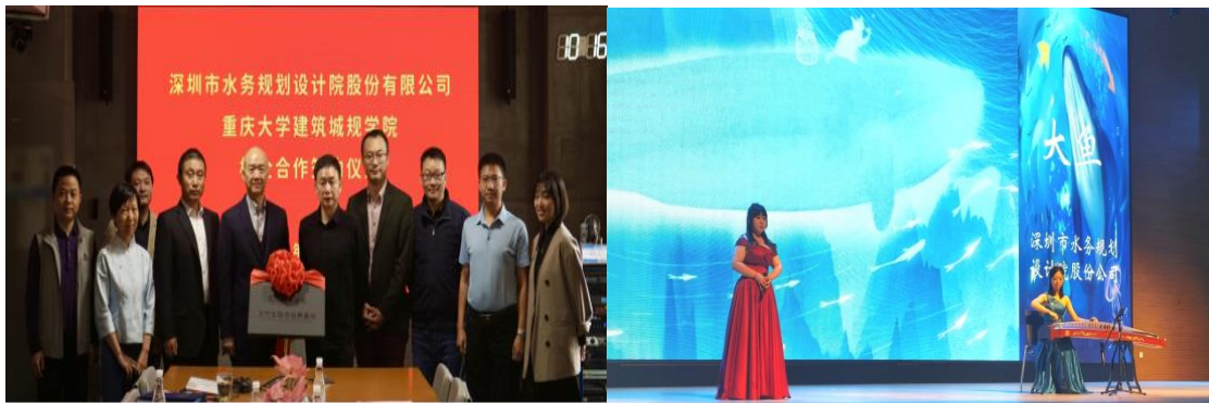
(图二：校企合作、文艺汇演)