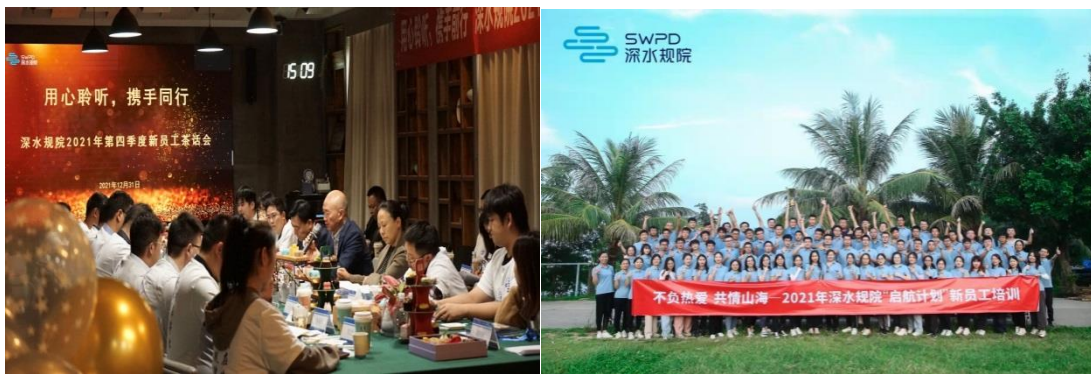
(图三：企业茶话会、新员工培训)