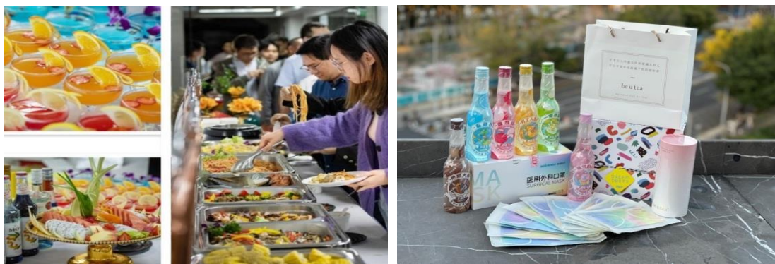
(图四：企业茶歇、节日礼品)